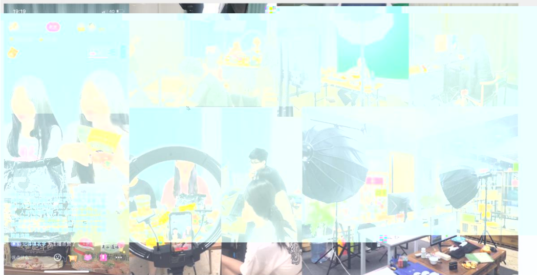
部份学员在进行电商直播实训现场